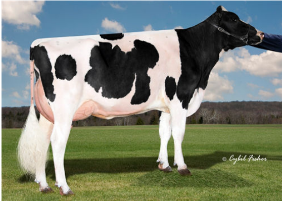
COOKIECUTTER RUBI HOMEY FIFTH DAM